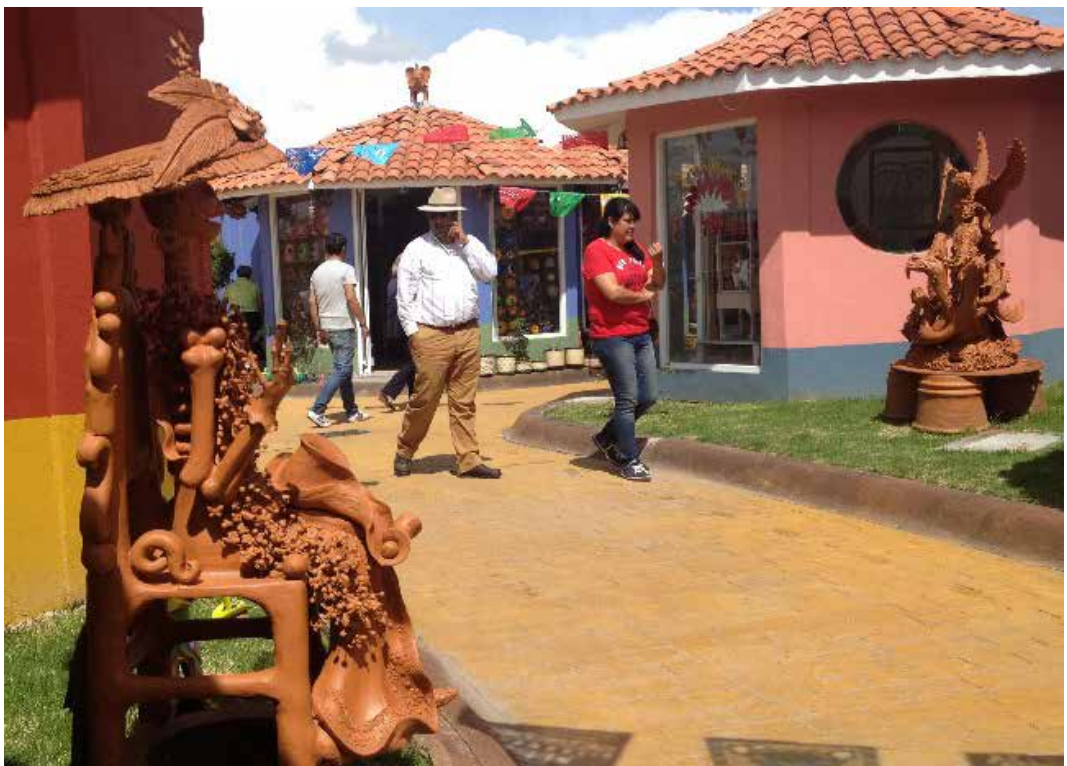
Figura 3: Turistas en el Mercado de Artesanías.

El trabajo en el Mercado Artesanal y la atención a los turistas y demás clientela, no exime a las mujeres de cumplir también con las tareas que socialmente se les suele asignar al interior de las unidades domésticas, como: preparar los alimentos para los miembros de la familia, limpiar, lavar, planchar, entre otras. Las mujeres con hijos pequeños también están al pendiente de la crianza y en muchas ocasiones las niñas y niños salen de la escuela y pasan las tardes en los locales, jugando, haciendo tareas escolares o ayudando a sus mamás o abuelas con pequeñas labores. Es común que las hijas o hijos adolescentes y jóvenes, que siguen estudiando, contribuyan en tareas de elaboración de piezas pequeñas, pintado, decorado o venta en el local.