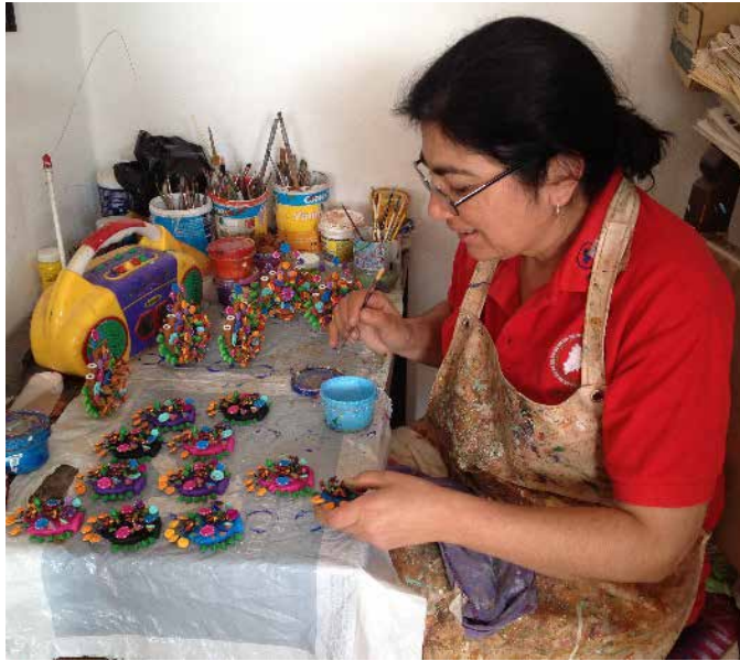
Figura 4: Artesana pintando.